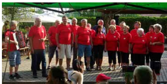
Spevácka skupina Nádej