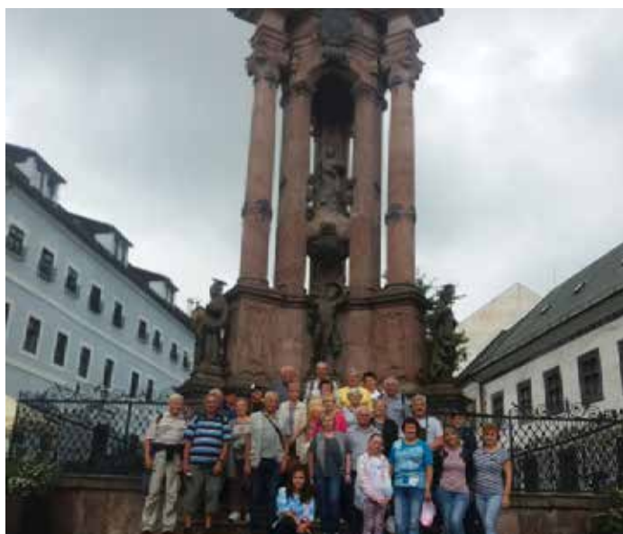
Návšteva Banskej Štiavnice