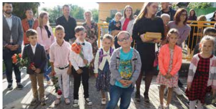
Do školy tento rok nastúpilo sedem prváčkov