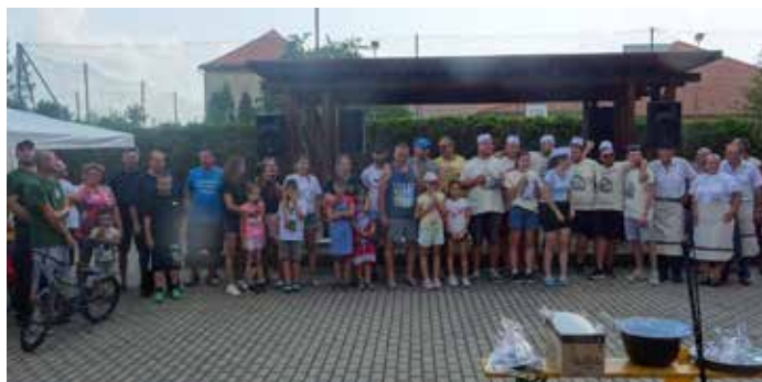
Ceny už čakajú na víťazov