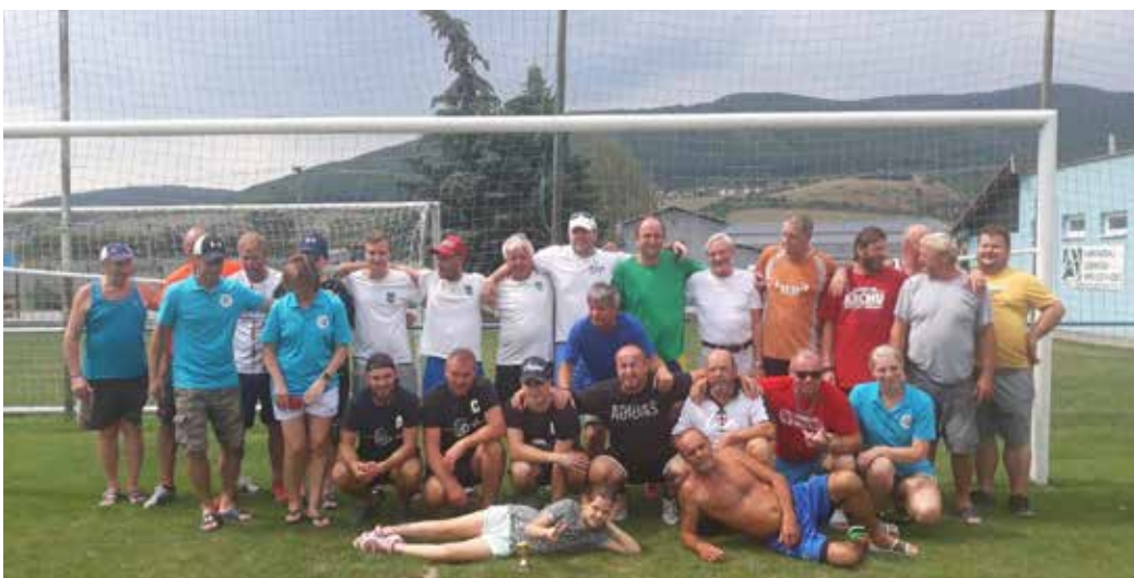
Rodina nohejbalistov v Tekovskej Breznici