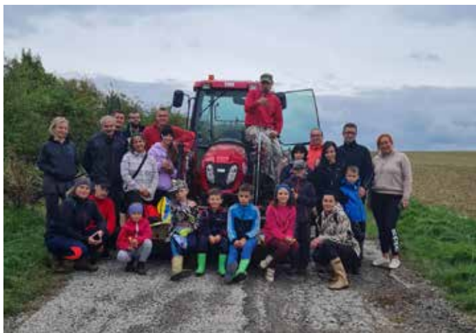
"Bojovníci" za čistotu

čistíme hlavu z uponáhľaného sveta, bicyklujeme, venčíme psíkov a Kocháme sa okolitými horami. Idylický opis majestátnych hôr a dokonalej prírody však narúšalo množstvo nelegálnych skládok, ktoré na tomto mieste rokmi vznikli. Prvotný nápad