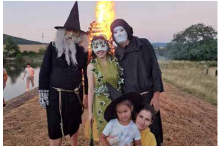
Vatra horela do neskorých hodín

o úpravu a kosenie zelených plôch okolo priehradu, pomoc na samotnom podujatí pri príprave jedál či čapovaní. Nemožno zabudnúť aj na členov MS SRZ vďaka ktorým sme si mohli pochutnať na pstruchoch. Im všetkým patrí veľká vďaka, pretože bez ich pomoci by nebolo možné toto podujatie takto úspešne zorganizovať. Dobrý chýr o tom, že aj v našej obci vieme usporiadať zábavné podujatie väčších rozmerov pre všetkých sa vzhľadom na vzrastajúci počet participujúcich nepochybne šíri ďalej a poďakovanie preto patrí aj všetkým