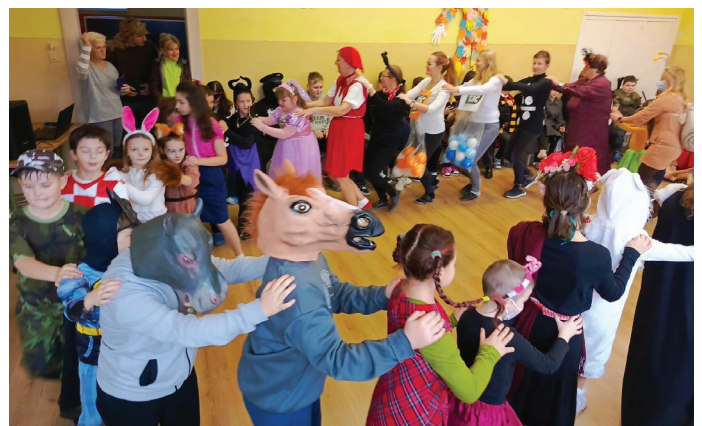
Fašiangy sme oslávili Maškarným plesom