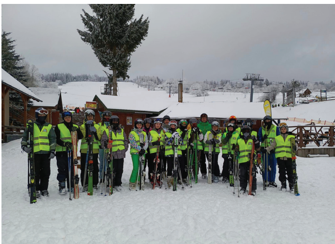
Lyžiarsky výcvik na Krahuliach