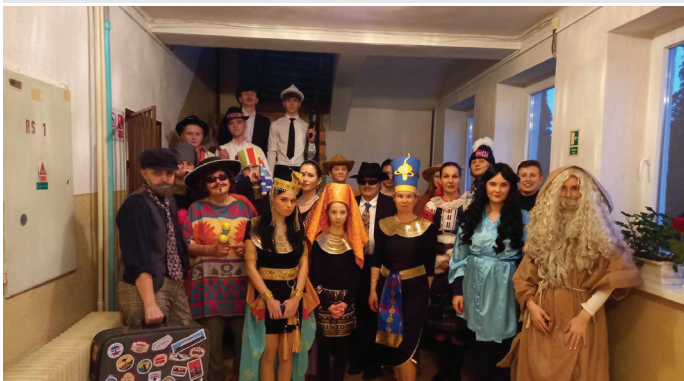
Máme za sebou Nočnú hru 17