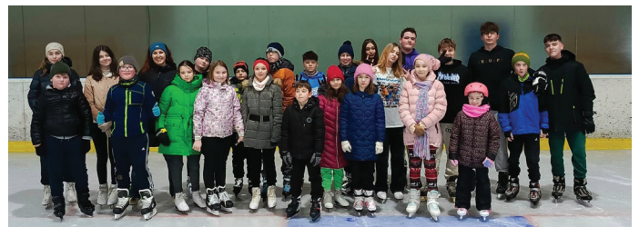
Korčuľovanie v Zlatých Moravciach sme si užili