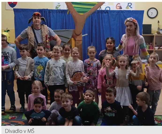
Divadlo v MŠ