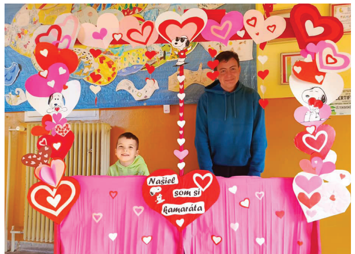
Aj takéto kamarátstva vznikli počas Dňa sv. Valentína