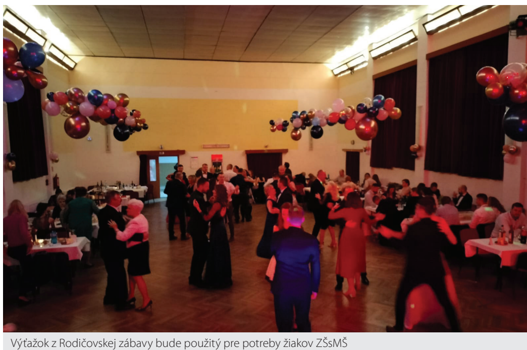
Výťažok z Rodičovskej zábavy bude použitý pre potreby žiakov ZŠsMŠ