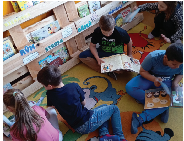
Marec s knihou

Škola však nezostáva len pri organizovaní podujatí, ale aj aktívne inovuje vyučovací proces. Na