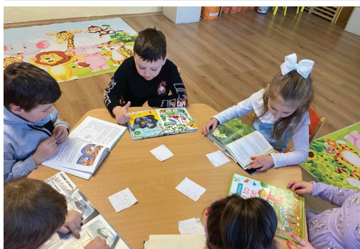
Mesiac knihy v MŠ