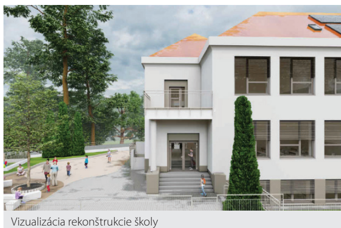
Vizualizácia rekonštrukcie školy