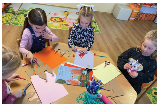
Z rozprávky do rozprávky