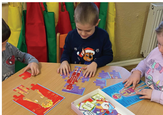
Téma Moje telo