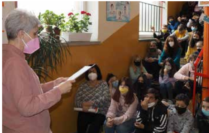
Slávnosť činov - vyhodnotenie výchovno - vzdelávacích výsledkov