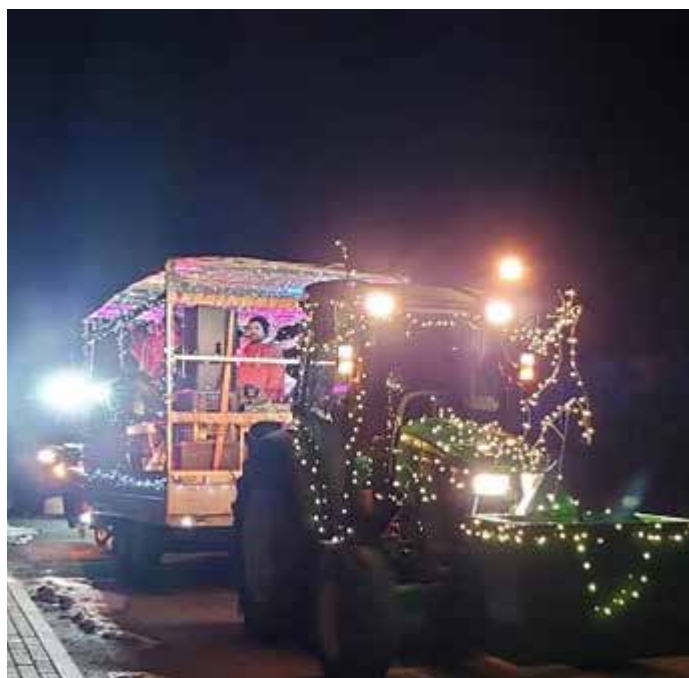
Vysvietený sprievod v uliciach Tekovských Nemiec

Už je zima, už je čas! Mikulášsi majú zraz. Jeden pôjde rovno k nám, na toho sa pamätám. Krásne Vianoce a šťastný Nový rok želá