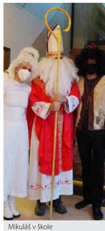
Mikuláš v škole

Za celý kolektív pracovníkov školy Vám želáme zdravé a štedré Vianoce, veľa lásky a porozumenia, ktorého dnes tak veľmi chýba.