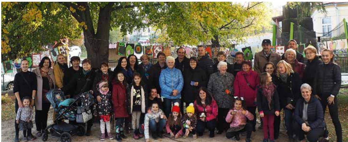
Deň starých rodičov