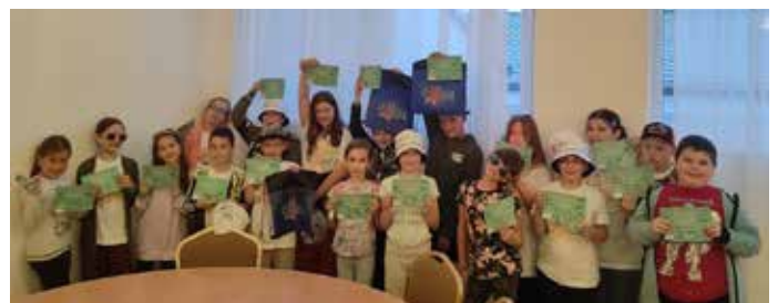
Škola v prírode v Bojniciach