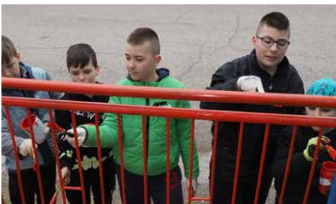
Deň Zeme - natieranie plotu