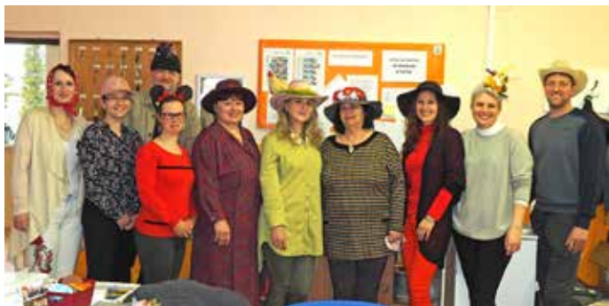
1. apríl - deň veselých pokrývok hlavy v ZŠ