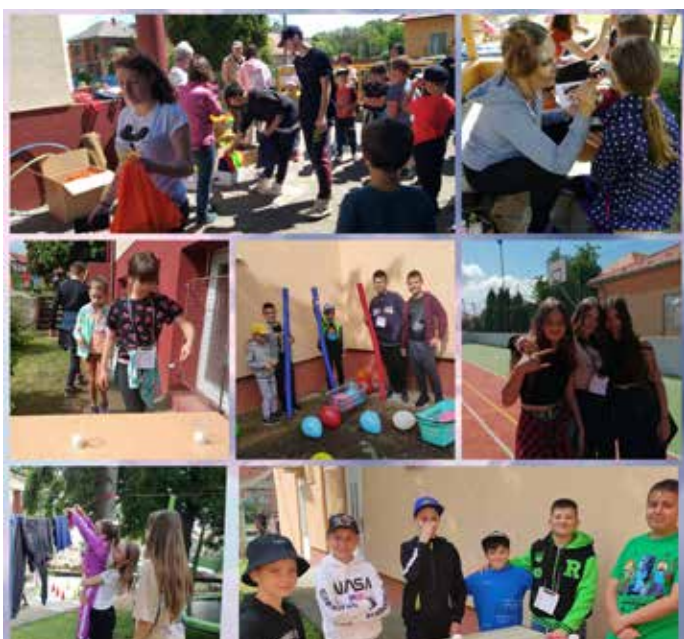
MDD na školskom dvore