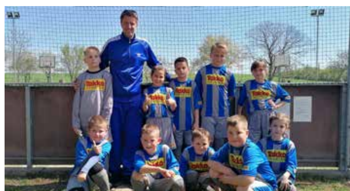
Mladší žiaci na turnaji v Slažanoch