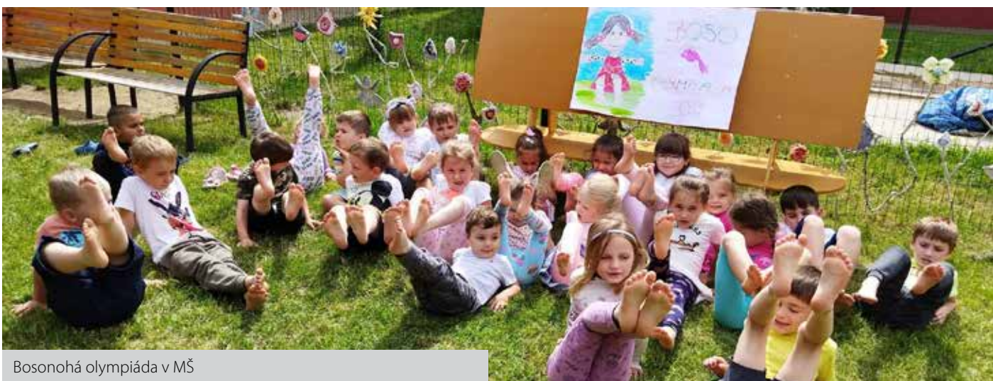
Bosonohá olympiáda v MŠ