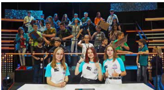
NAJ škola- natáčanie v RTVS