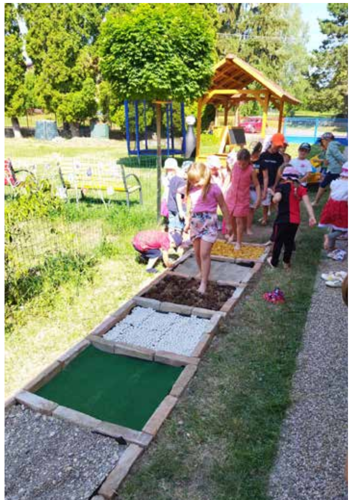
Realizácia pocitového chodníka v MŠ