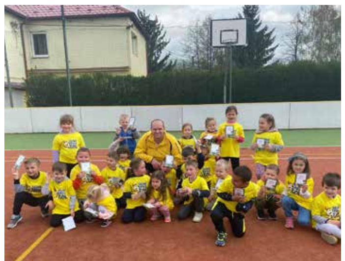
Medzinárodný deň futbalu v MŠ