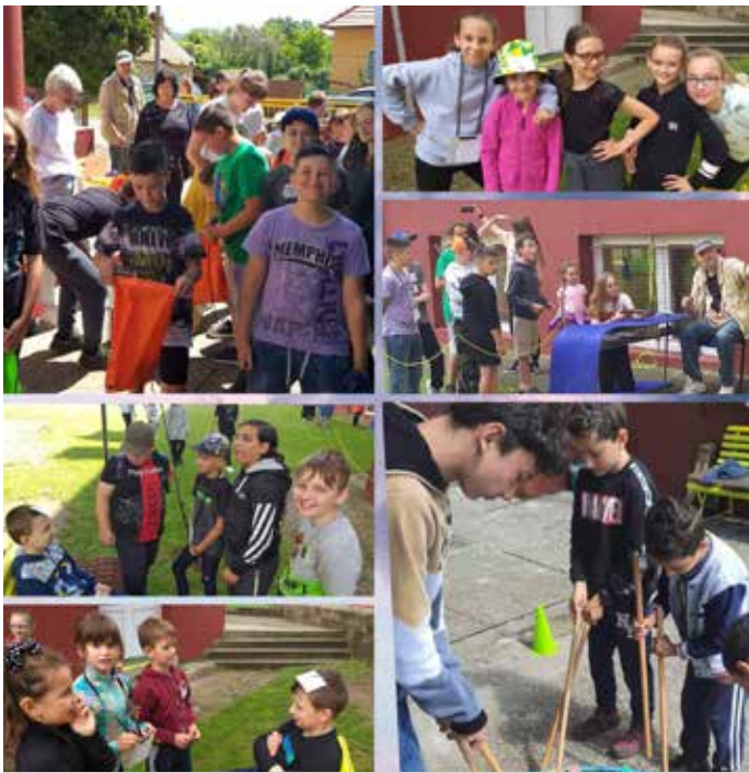
MDD v škole