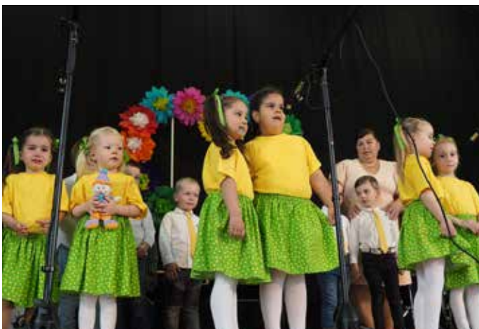
Vystúpenie ku Dňu matiek