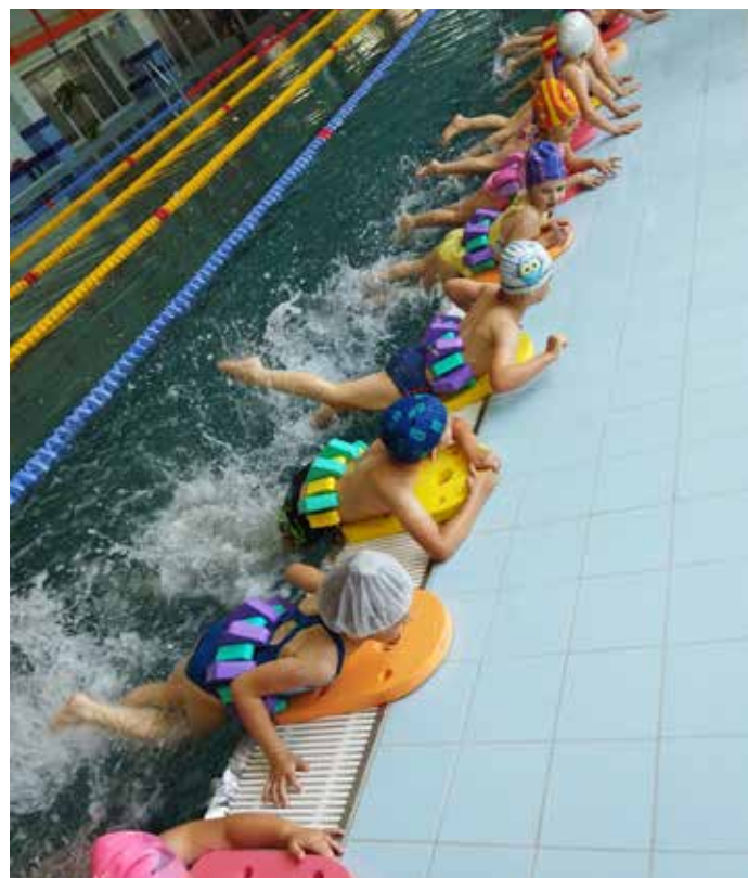
MŠ na plaveckom výcviku v Leviciach