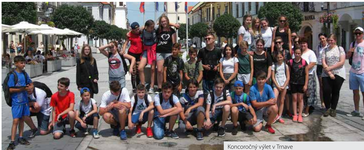
Koncoročný výlet v Trnave