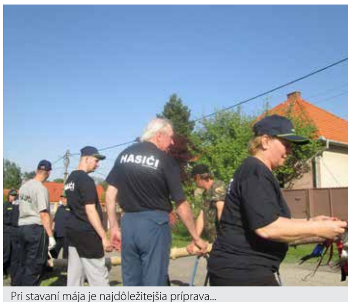
Pri stavaní mája je najdôležitejšia príprava...