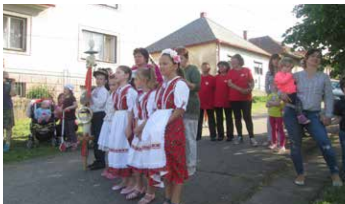
Stavanie mája spestrili spevom žiačky ZŠsMŠ